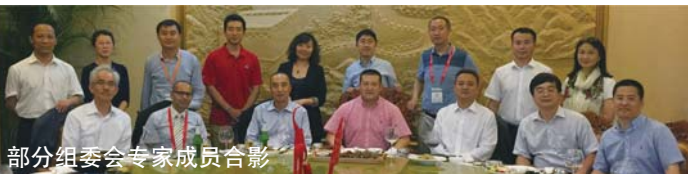
部分组委会专家成员合影